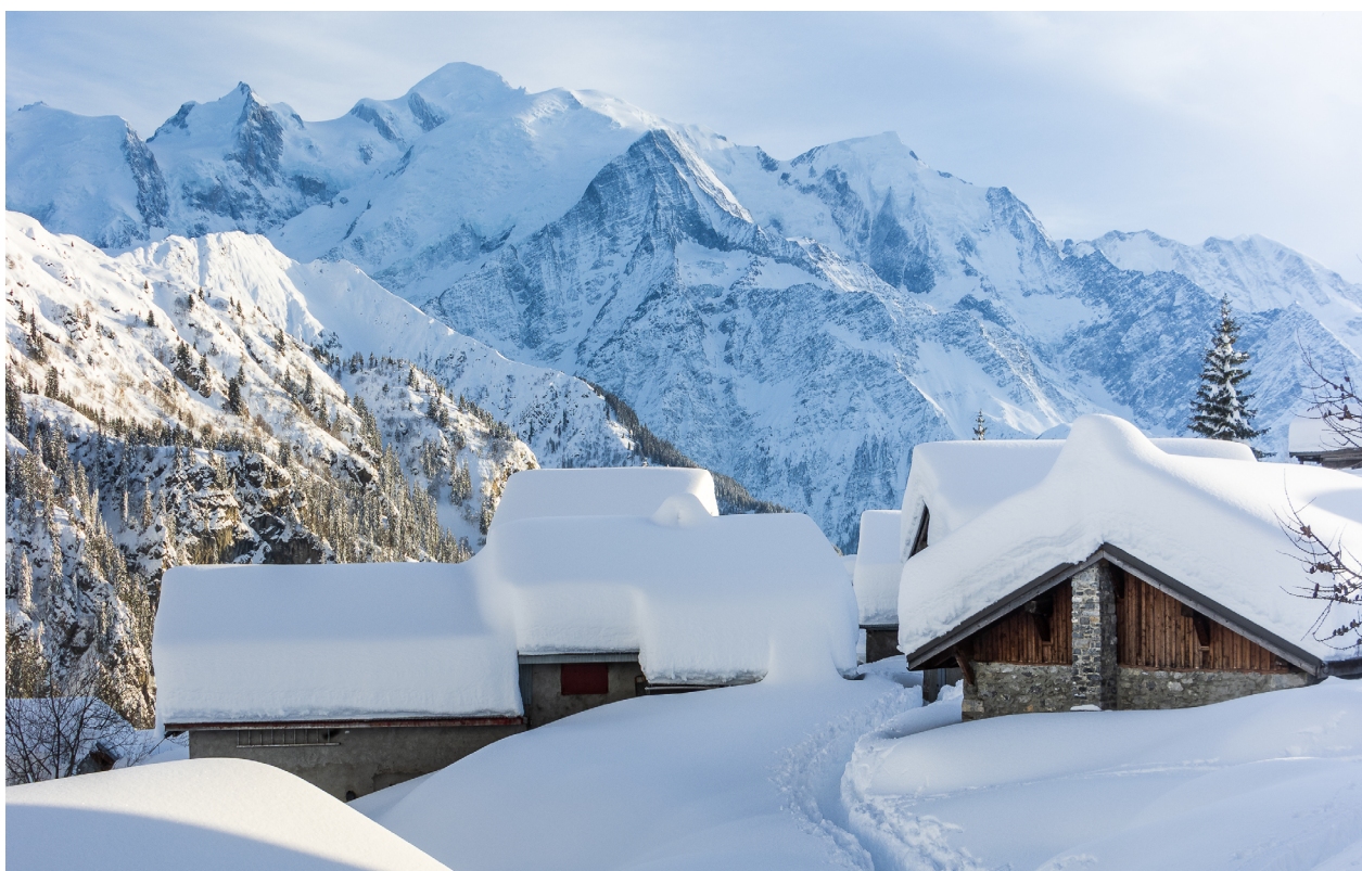
Passy Mont-Blanc

La Haute-Savoie confirme son attractivité avec une saison hiver 2025-2026 marquée par de très bons niveaux de fréquentation, une activité bien répartie dans le temps et une dynamique positive sur l'ensemble des territoires de montagne.